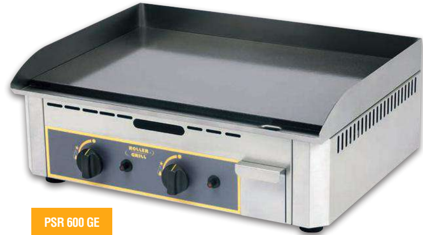
PSR 600 GE