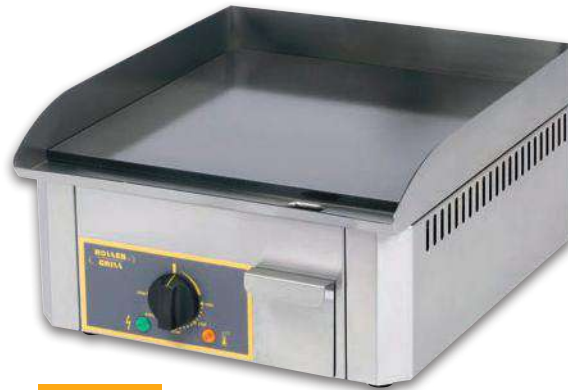
PSR 400 EE

The best of the enamelled steel: best quality of finishing thanks to enamel. Mass enamel with good rub resistance. Very smooth -> optimal heat transfert.