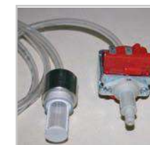
Pompe à eau / Water pump (FC 60 P)

Unique in restauration, le four multifonction FC 60 TQ® allie :