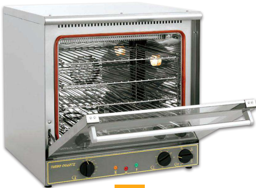
FC 60 TQ®