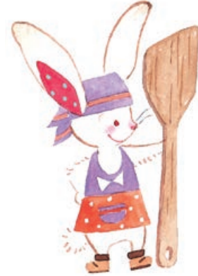
Bạn thỏ Machen: luôn quan tâm đến mọi người và rất lãng mạn.