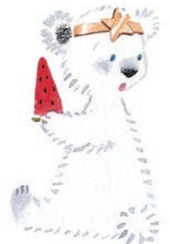
Gấu Bắc cực Jimny: dễ mềm lòng và nhẹ nhàng, điềm tĩnh. Bạn tốt của hai anh em Pinguino và Punguino.

Ông dê Bohee: là một trường lão đáng tin cậy, luôn xuất hiện vào những lúc quan trọng nhất.