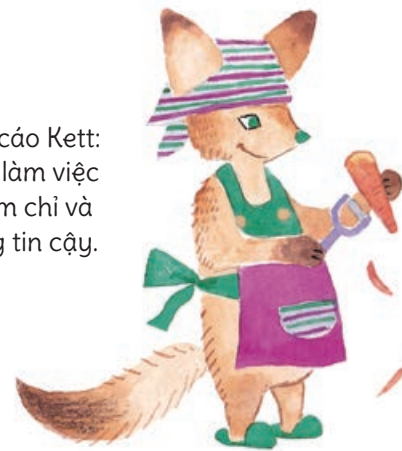
Chú cáo Kett: luôn làm việc chăm chỉ và đáng tin cậy.