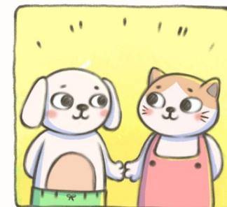
Bài viết lấy chất liệu và cảm hứng từ Làng Mai.